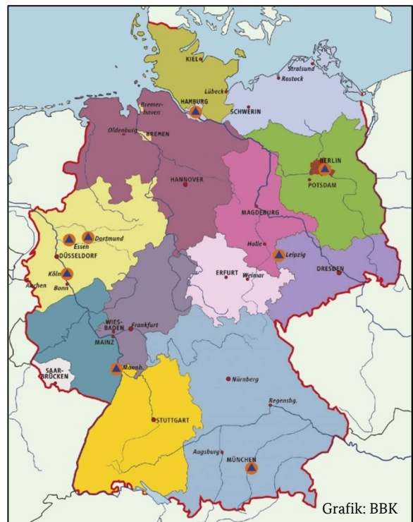
Abb. 1: Standorte der ATF