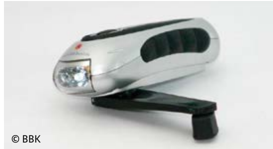
Eine Taschenlampe mit Handkurbel kann bei Stromausfall hilfreich sein.