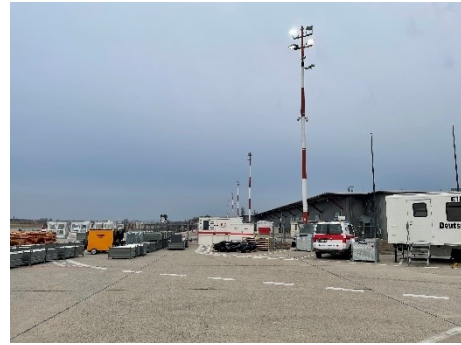
Ersatzstromerzeuger ESE 300 am ehem. Flughafen Tegel