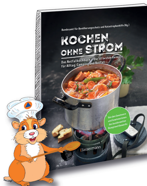
Grafik mit Buchmaske und Cover des Buches „Kochen ohne Strom“.

Um diese zu sammeln, riefen die beteiligten Organisationen im Kontext des Bonner Katastrophenschutztags die Bevölkerung im Jahr 2020 mit einem bundesweiten Rezeptwettbewerb dazu auf, kreative Kochideen einzureichen, die sich auch unter starken infrastrukturellen Einschränkungen zubereiten lassen. Das Ausgangsszenario war ein länger andauernder Ausfall der Strom- und Leitungswasserversorgung ohne Verfügbarkeit frischer Lebensmittel. Über 195 Tage hinweg nahmen 292 Personen teil. Aus deren 522 Rezeptvorschlägen wählte eine fachkundige sechsköpfige Jury anhand festgelegter Kriterien die 50 besten Rezepte aus, die Eingang ins Buch fanden.