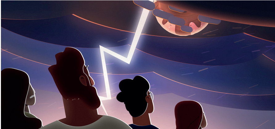
Illustration zur Kampagne.

pertise von Fachleuten und dem Wissen der Bevölkerung schöpft: Das ist das Konzept des Notfallkochbuchs „Kochen ohne Strom“, das im September im Bassermann Verlag erschienen ist.