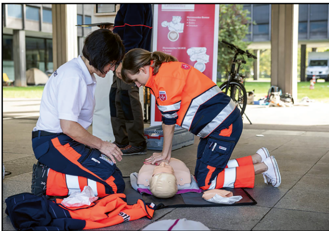
Reanimierungs Übungen an der Erste-Hilfe-Station.

Zum Abschluss der Tagungswoche anlässlich des 70-jährigen Jubiläums sind Teams bestehend aus Einsatzdiensten, Schulsanitätsdiensten und Malteser Jugend bei einer Challenge angetreten – und hinterließen Eindruck bei Passanten, Präsidium und dem Malteserorden.