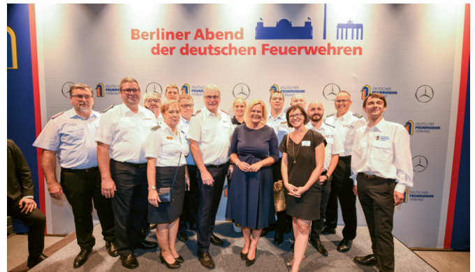
Bundesinnenministerin Faeser (Mitte) auf dem Berliner Abend der deutschen Feuerwehren.