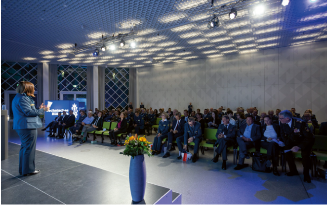
Feierlichkeiten zu Einführung der neuen Führungsspitze des THW.

das THW im Kern ausmacht, sind für sie dafür unabdingbar. Ebenso wie der Wille, Bewährtes nicht aus den Augen zu verlieren und gleichzeitig das Bisherige weiterzuentwickeln – oder auch mal neu offen zu denken.