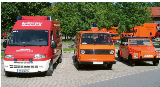
Drei Generationen von CBRN-Erkundungswagen beim Tag der offenen Tür des ABC-Zugs München-Land.

Vor 50 Jahren konnten das erste Mal sogenannte Regieeinheiten zur Stärkung des westdeutschen Katastrophenschutzes beitragen. Seitdem erlebten die Regieeinheiten zwar eine wechselvolle Entwicklung, die stärker als bei anderen Katastrophenschutzorganisation von den Umbrüchen in den 1990er-Jahren beeinflusst war, sie waren aber zu jeder Zeit wesentliche Partner im deutschen Hilfeleistungssystem und werden es weiterhin sein.