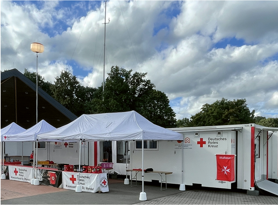
Das mobile Küchenzentrum.

unter anderem herauszufinden, welche Schwierigkeiten es beim Aufbau gab, von welchem Zeitansatz ausgegangen werden sollte, ob die im Vorbereitungs- und Küchencontainer verbauten Geräte einfach zu bedienen waren oder bessere Anleitungen benötigt werden.